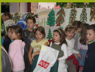
Ukázky soutěžních výtvarů a předávání cen za účasti AVE Kralupy s.r.o.